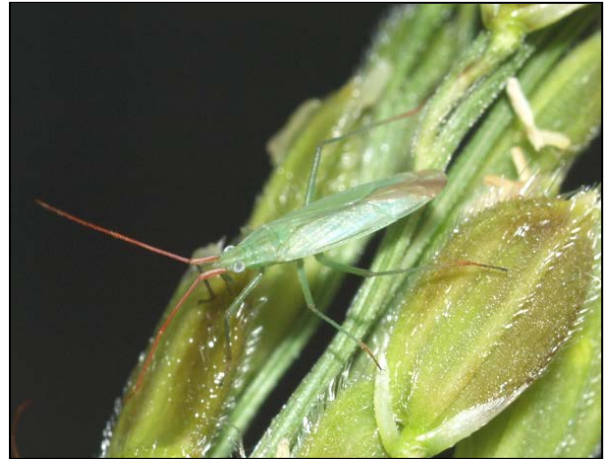
写真2 アカヒゲホソミドリカスミカメ