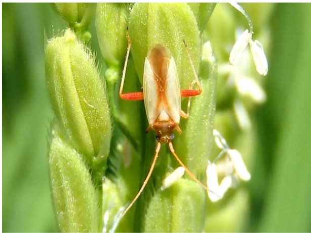
写真1 アカスジカスミカメ