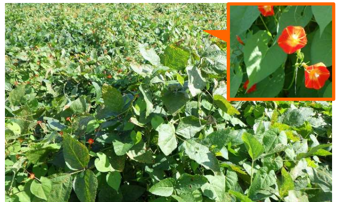
写真 帰化アサガオ類（マルバルコウ）が繁茂した大豆圃場 (令和4年9月 鶴岡市)