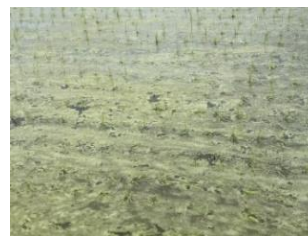
表層剥離の発生した圃場