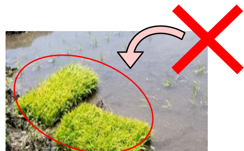
取置き苗は直ちに処分