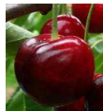
■「やまがた紅王」の過着色果