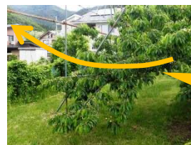
果実の重みで下がった枝は吊り上げる