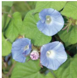
マルバアメリカアサガオ