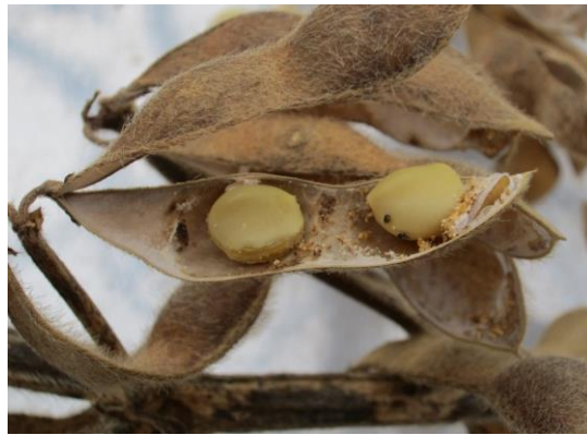
マメシクイガに食害された莢と子実