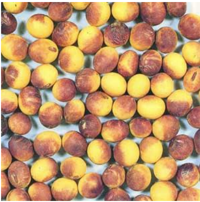
紫斑粒（子実の発病）