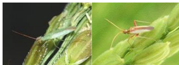
アカヒゲホソミドリカスミカメ アカスジカスミカメ