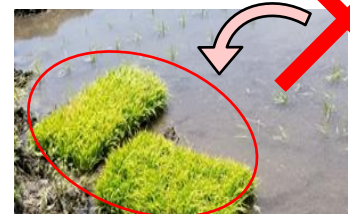
取置き苗は直ちに処分