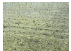
表層剥離の発生した圃場