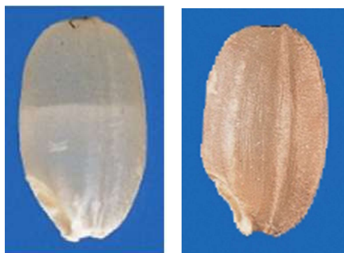
図1 左：胴割粒 右：着色粒 (農林水産省HP)