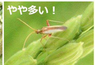
アカスジカスミカメ