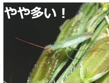
アカヒゲホソミドリ カスミカメ