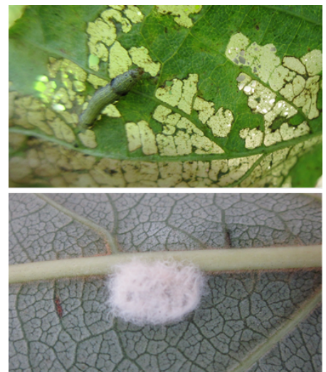
図2 だいずの食害状況（上）と卵塊（下）

農薬の使用にあたっては、農薬使用基準（適用作物、収穫前使用日数、使用回数等）を遵守するとともに、隣接地や周辺作物へ飛散しないよう十分留意し、農薬の使用後は防除日誌の記帳を行う。