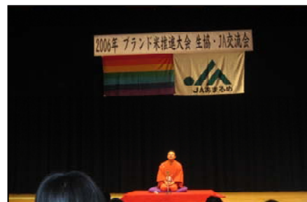
落語講演「食の法則」