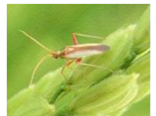
アカスジカスミカメ