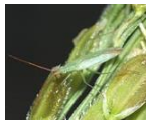
アカヒゲホソドリカスミカメ