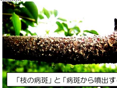
「枝の病斑」と「病斑から噴出する孢子」