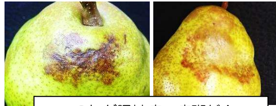
これが胴枯病の病斑だ！ 様々な症状がある。発病初期の果肉は硬質化しているが、のちに褐変。選果で見分けにくい。

昨シーズンは胴枯病被害果の混入がみられました。他の果樹の作業も忙しい時期ですが、 西洋なしの防除も徹底 しましょう！