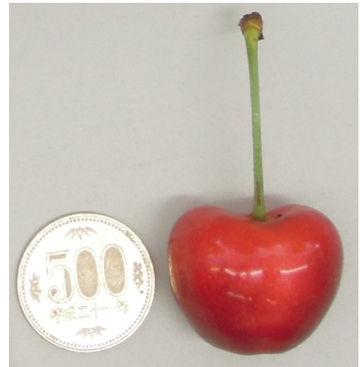
■「山形C12号」の果実(実物大)