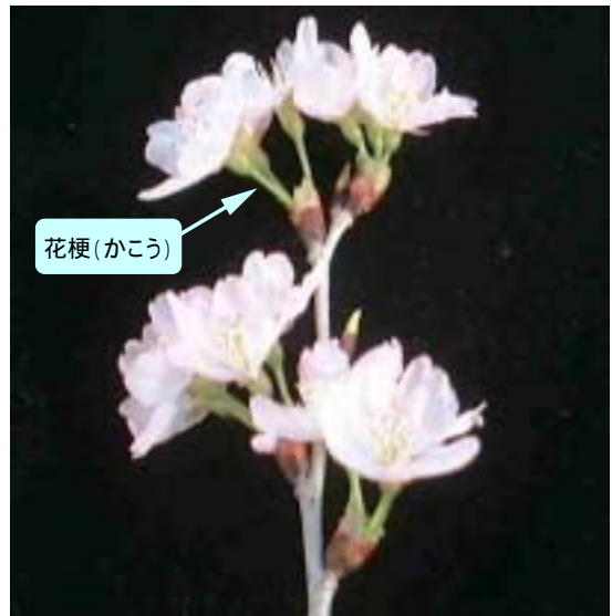
写真1 開花した啓翁桜