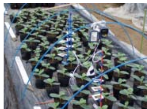
側枝を揃えるための育苗法の検討