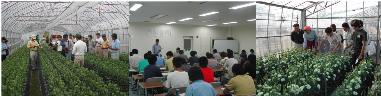
図5 新規栽培者の現地研修